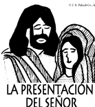
LA PRESENTACION DEL SEÑOR

El Miércoles, 2 de Febrero, celebramos la Fiesta de la Presentación de Jesús en el Templo. Las velas se bendecirán durante la Misa de las 9:00a.m.