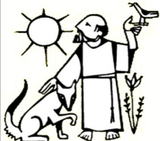
Francis of Assisi The Blessing of the Animals Celebrating the Feast of St. Francis

Bring your pets for a blessing in honor of Saint Francis of Assisi!