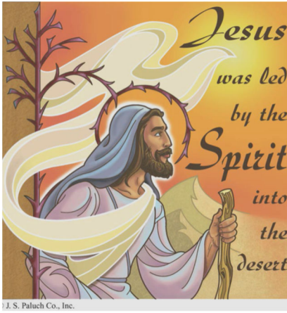
J. S. Paluch Co., Inc.